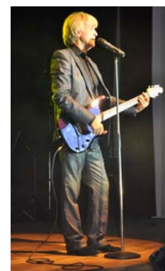
DAVE en concert à Illiers le 19 octobre 2012