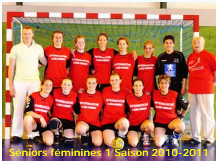
Séniors féminines 1 Saison 2010-2011

Saison 2009/2010 : des résultats au Handball....