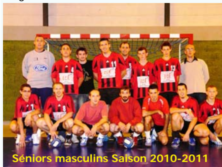
Séniors masculins Saison 2010-2011