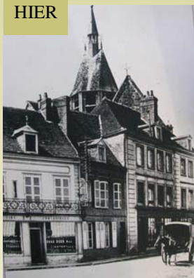
Avant les bombardements